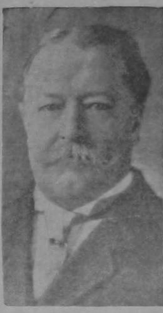
WILLIAM H. TAFT

á los mercaderes profanadores del Templo. Con el advenimiento de los Demócratas se oyen ya las voces enérgicas de la reparación, y un gran viento purificador parece soplar bajo el cielo de la Patria Americana. El pueblo de Washington despierta; la imagen volverá á resplandecer sobre el pedestal granítico; y publicanos y fariseos serán expulsados del santuario. Dios lo quiera! Tales son las esperanzas fundadas por los pueblos de América en el triunfo que simboliza la excelsa personalidad del universitario Wilson: ojalá que no sean defraudadas por una realidad amarga y desconsoladora, para que la sombra protectora de Jorge Washington vuelva á imperar solemne entre las arcadas del Capitolio y el pueblo americano sea otra vez el pueblo protector de todos los países libres.